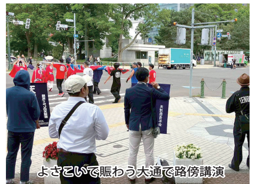
よさこいで賑わう大通で路傍講演

流しをされており、共に布教活動するお互いが勇みをいただいた。また、おちばがえりをされた事のある方に声を掛けていただくなど、小雨降る中にも益々勇んだ布教活動となった。