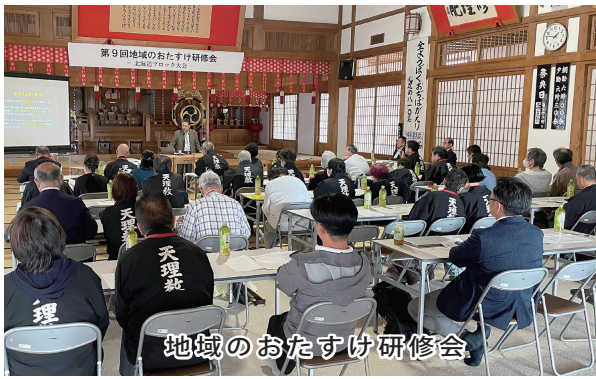
地域のおたすけ研修会

成果を交えながら、障害のある児童やその保護者との関わり方、子どもの成長を支えるために大切な視点について解説。参加者は、支援に携わる上で求められる理解と寄り添いの姿勢について学びを深めた。