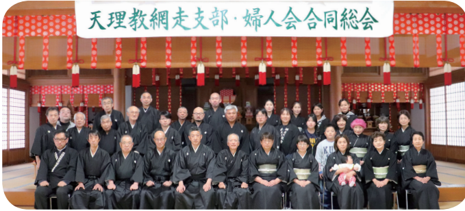
天理教網走支部・婦人会合同総会