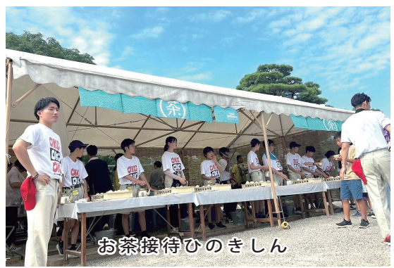
お茶接待ひのきしん

最終日、神殿にて御礼参拝をしたのち、話所までの道のりを、元気に揃って歩く隊員達の姿は感慨深いものがありました。感想文の中にはまた来年も参加したいとの声が多くあり、本